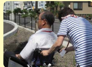
車いすの使い方と 移乗介護