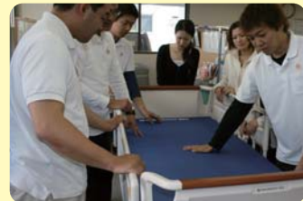
快適な住環境設備と介護